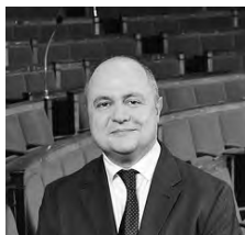
Bruno Le Roux

Président du groupe SRC Assemblée Nationale