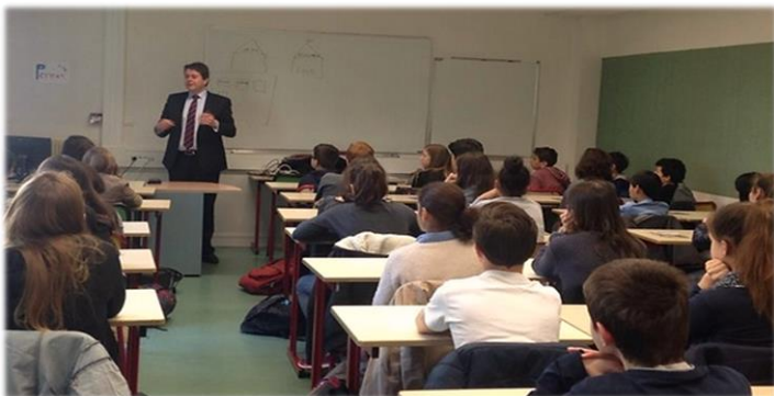
Collège Chevreul, Angers, avril 2015

Depuis quinze ans, le nombre d'élèves en difficulté n'a cessé d'augmenter. À la fin du collège, 25 % des élèves ne maîtrisent pas les compétences de base en français, et 13 % celles qui sont nécessaires en mathématiques. C'est pourquoi, la réforme s'attache à résoudre point par point les difficultés posées aujourd'hui :