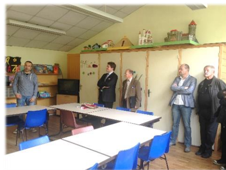
Restaurant scolaire de Pellouailles les vignes, octobre 2014