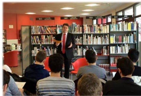
Lycée Saint-Aubin de la Salle, Saint-Sylvain d'Anjou, mars 2015

Cette nouvelle aide permet également de proposer des outils numériques qui permettront de répondre aux besoins de notre société mais également aux nouveaux programmes qui ont une approche ambitieuse à ce sujet.