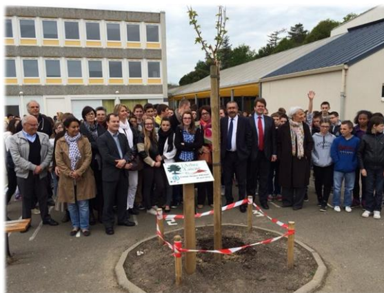
Inauguration de l'arbre de la laïcité Collège Jacques Prévert Châteauneuf-sur-Sarthe avril 2014

L'enseignement moral et civique fait partie des nouveaux contenus d'enseignement introduits par la loi pour la refondation de l'École de la République en 2013. Les événements de janvier dernier ont rappelé la nécessité d'un tel enseignement, qui participe à l'apprentissage et à la construction d'un mieux-vivre ensemble. Celui-ci entrera en vigueur à l'école, au collège et au lycée dès la rentrée 2015 , à raison d'une heure hebdomadaire à l'école élémentaire, de 30 minutes hebdomadaires au collège et au lycée.